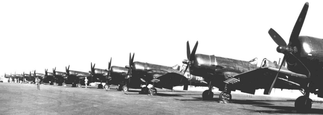
Corsair F4U-7 de la flottille 15F à Télérgma