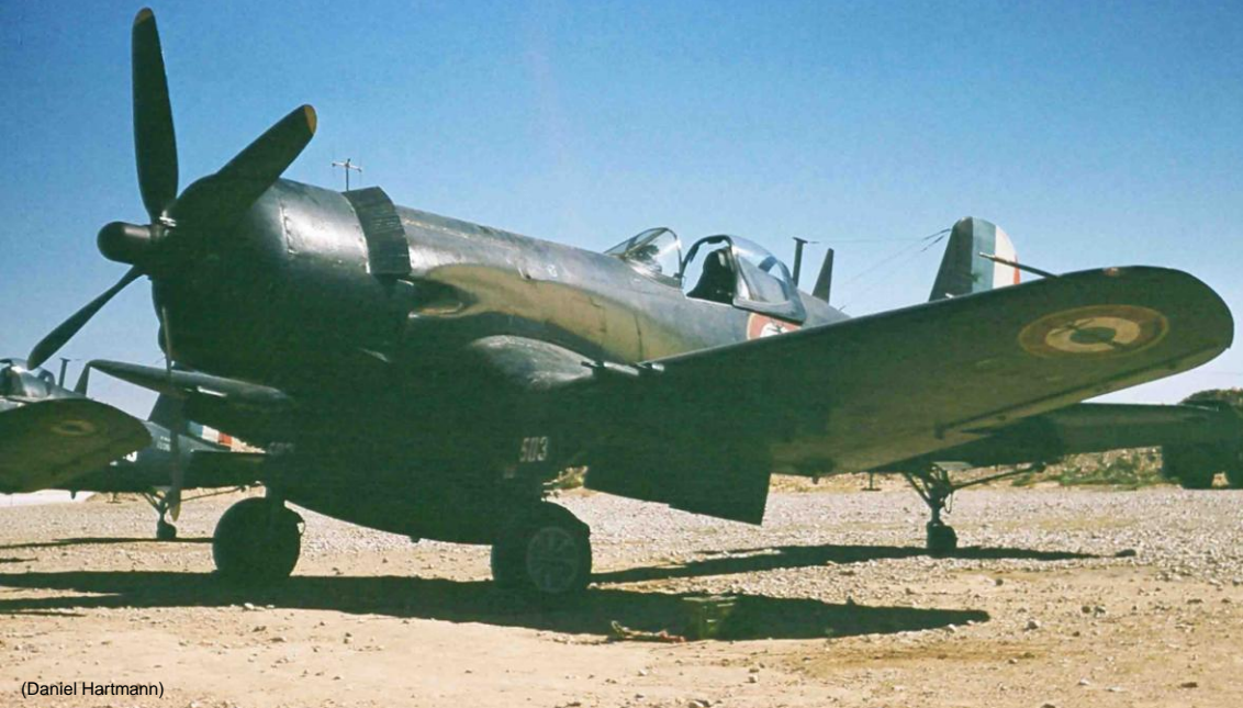
Corsair F4U-7 de la flottille 15F à Bou-Saâda en août 1959