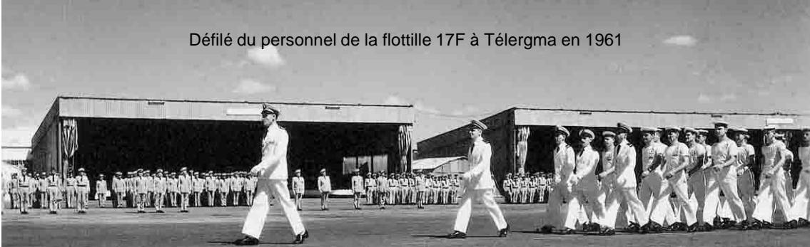
Défilé du personnel de la flottille 17F à Téliergma en 1961