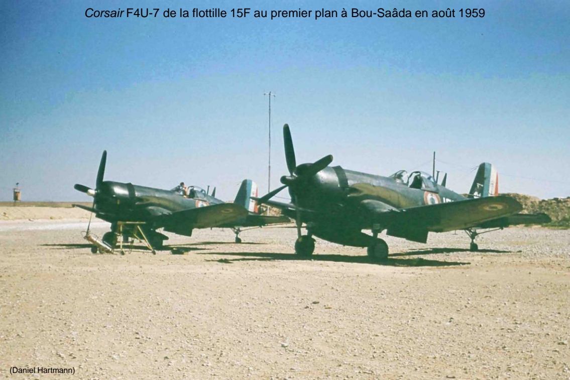
Corsair F4U-7 de la flottille 15F au premier plan à Bou-Saâda en août 1959