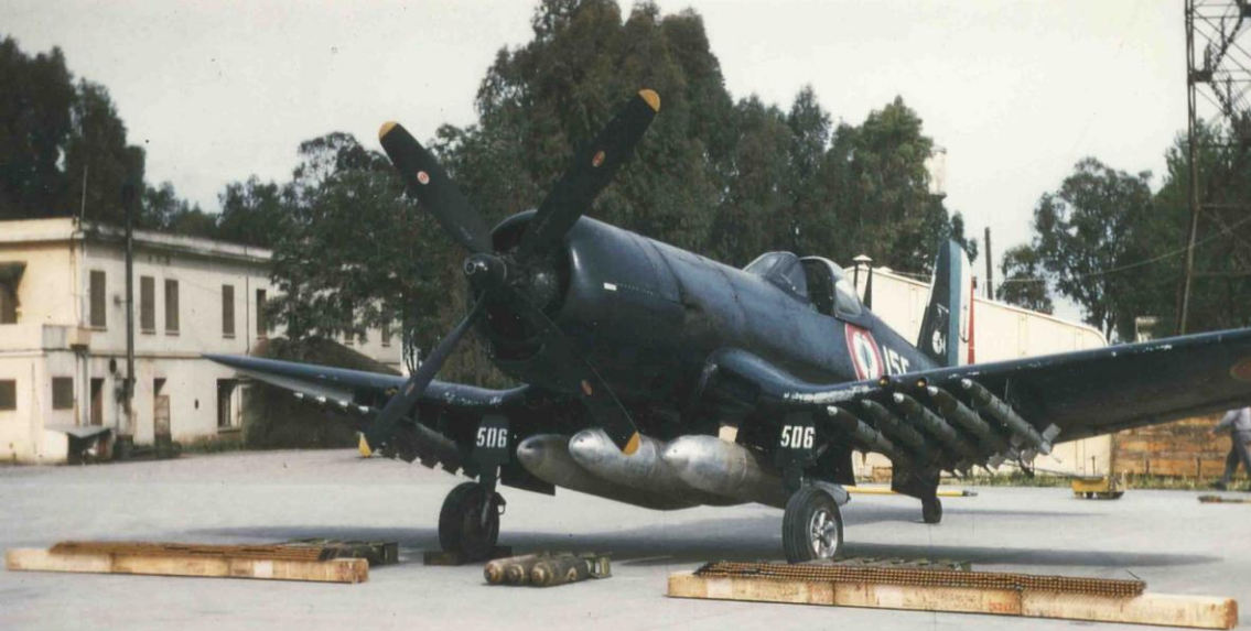
Corsair F4U-7 de la flottille 15F à Maison-Blanche en 1959 (casserole d'hélice noire)