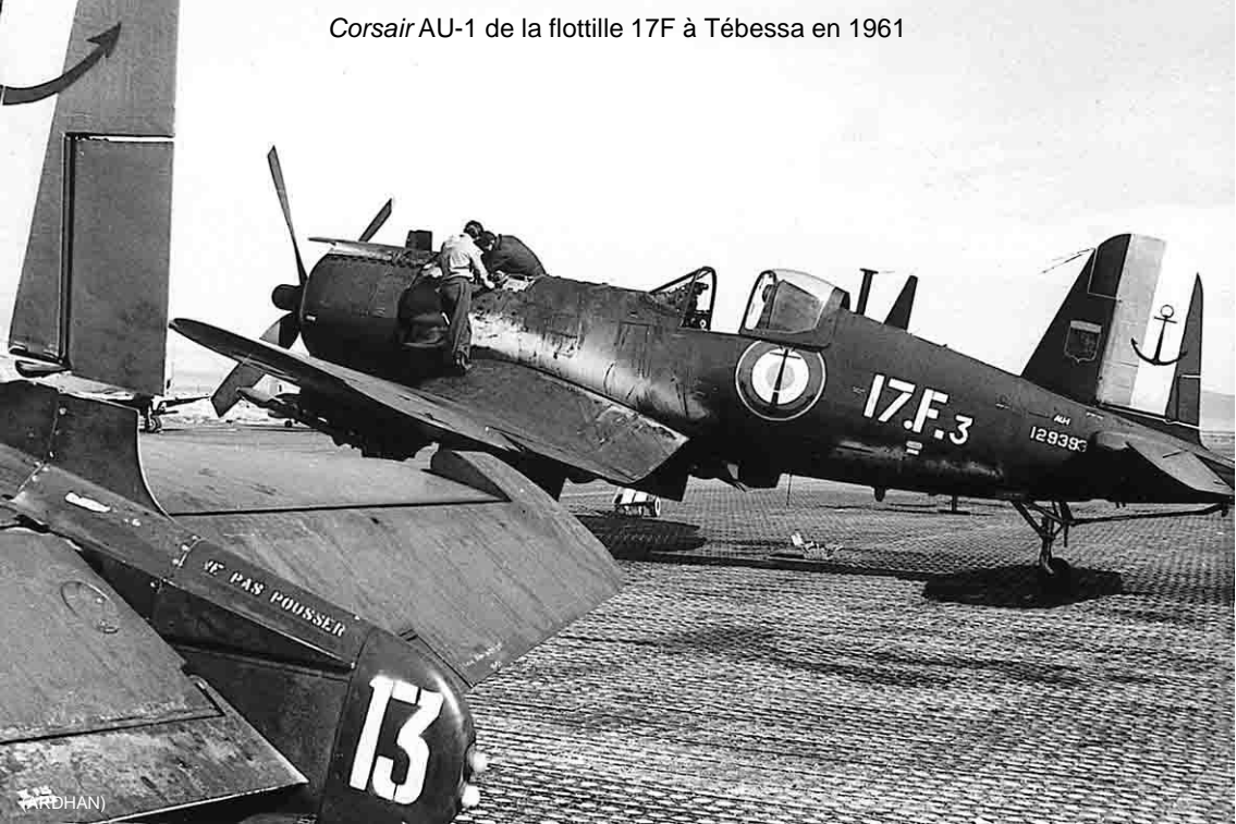
Corsair AU-1 de la flottille 17F à Tébessa en 1961